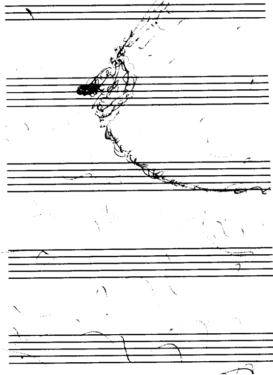
WERK: M. BODDÉ, TITEL: 'TITEL', 2018 GOUACHE OP ETS, € 9,75